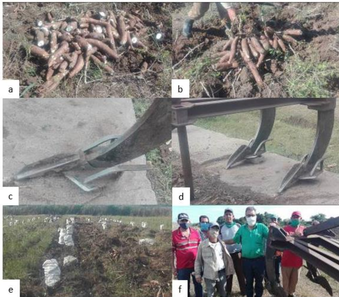
Figura 2. a: yucas cosechadas con el apero “INIVIT-2020”; b: yucas cosechadas de forma manual; c y d: diseño del apero; e: cosecha de la yuca con el apero; f: equipo de trabajo diseñador del apero.